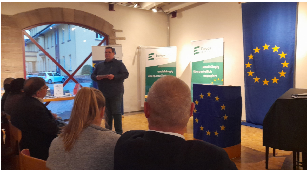
Altes Rathaus Stadtoldendorf am 5.Okt.2023 – Auch wir waren als Hamelner und Pyrmonter eingeladen zur Diskussion gemeinsam mit Experten aus Politik und Zivilgesellschaft über die Bedeutung der EU europäische Förderprojekte in der Region und Möglichkeiten zur Bürgerpartizipation auf kommunaler und europäischer Ebene.

Wir zwei Vorstände haben Sorge, dass hier unsere Mitglieder aus Pyrmont und Hameln nicht ausreichend mitziehen! Das wäre fatal, denn auf Dauer können wir mit dem Rumpfvorstand das bisherige Angebot nicht weiter aufrechterhalten. Eigentlich bin ich nach der Abstimmung