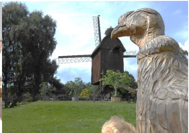
bis Vogelpark Walsrode