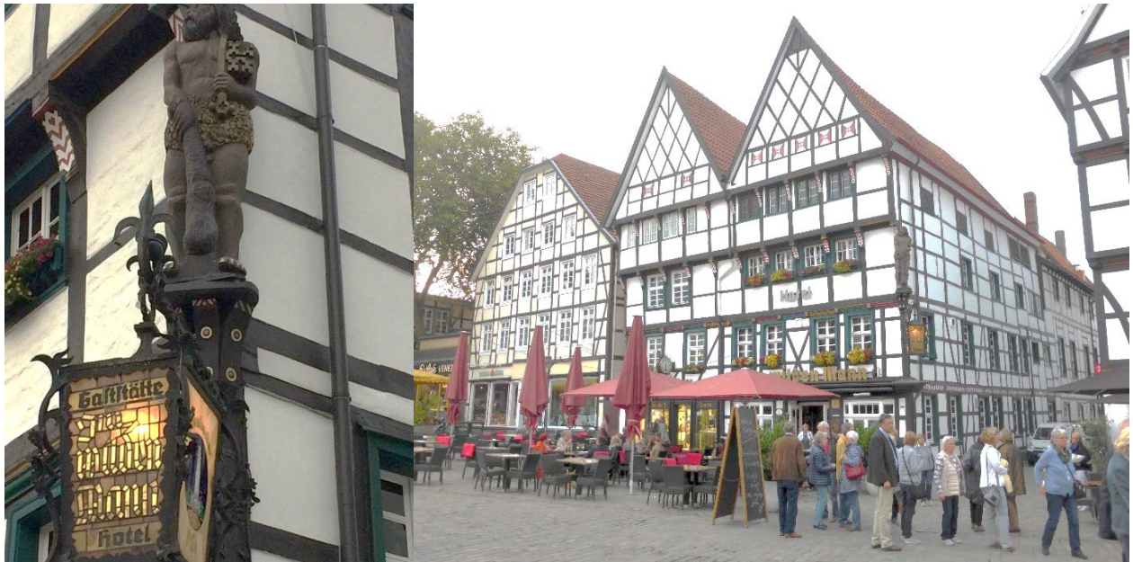
zwei Stunden vor BP im Hotel „Im wilden Mann“, Soest