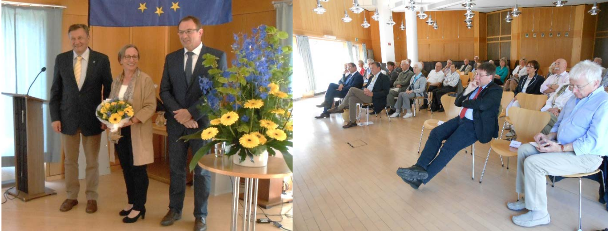
MdB und ParlStS'in G. Lösekrug-Möller beim Festvortrag zum Europatag 2016