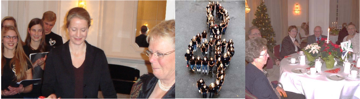
2014 Der Humboldt-Chor als Violin-Schlüssel & im Fürstensaal & Hameln-Tisch

An die anwesenden Mitglieder werden kleine Präsente verteilt.