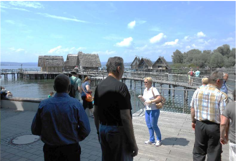
Besuch im Pfahldorf am Bodensee als länderübergreifendem Unesco-Welterbe