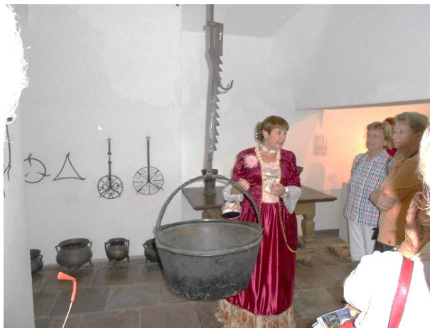
Von ...Küche vom Schleswiger Schloss