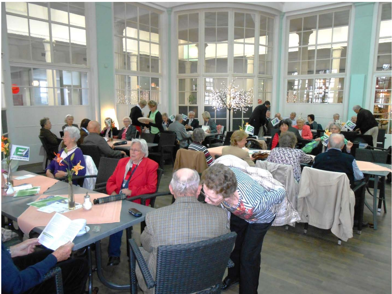
2014: Wie funktioniert die Wahl zum EP? Stadt und KV erklären dies in der Wandelhalle