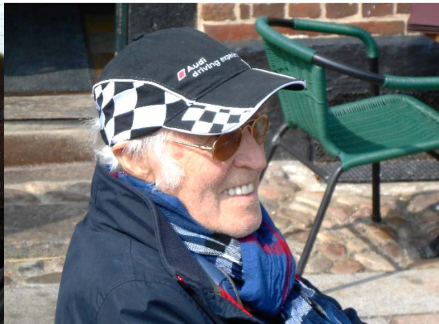
im Café in Dänemark's ältester Stadt RIBE: „Schaut mal, den kennen wir doch!“