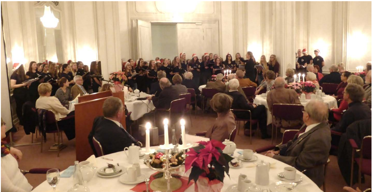
Mit über 80köpfiger Besetzung, Advent 2017

Jährlich wiederkehrend stehen also folgende Veranstaltungen auf dem Plan: hier noch einmal zusammengefasst: