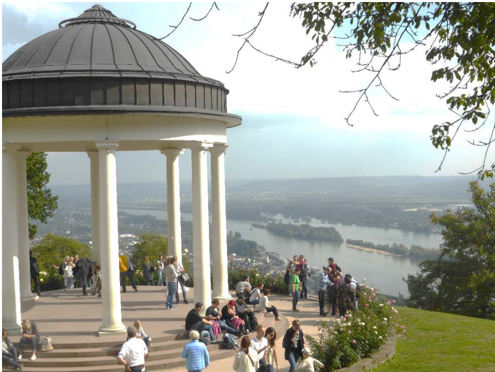
Blick zum Rhein bei Rüdesheim