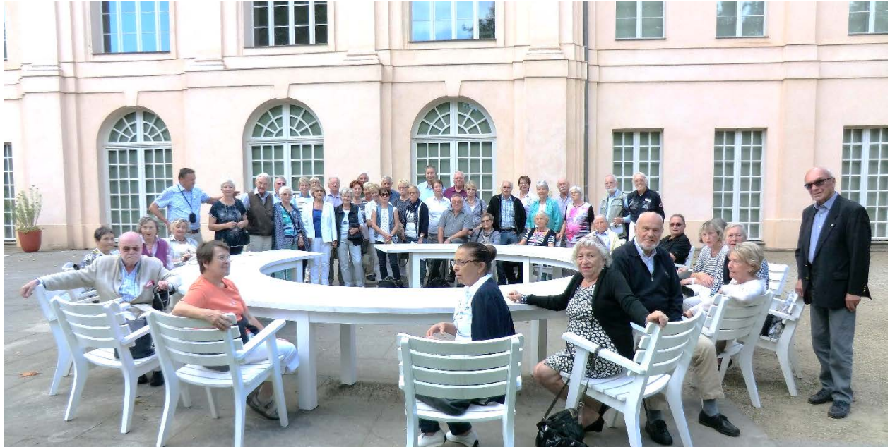
Am Runden Tisch in Schloss Schönhausen (Berlin)

er für interessierte Mitglieder eine exklusive Präsentation. Eine gemeinsame Kreuzfahrt so ab acht Personen wird im Vorstand als Option gesehen. Dabei wird wohl der Variante Fluss-Kreuzfahrt der Vorzug geben. Beispielsweise von Köln aus den Rhein entlang.