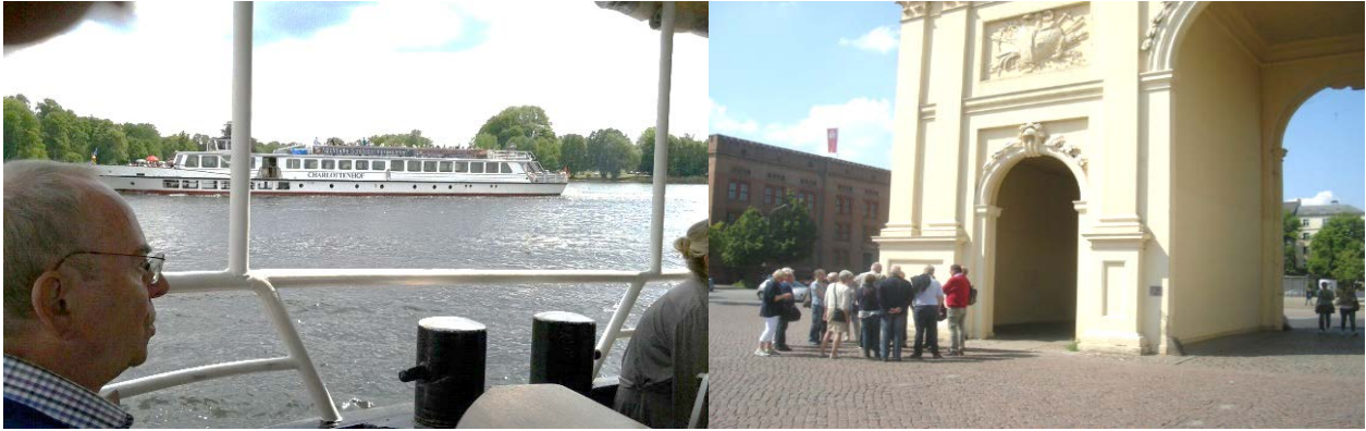
Fotos von Potsdam