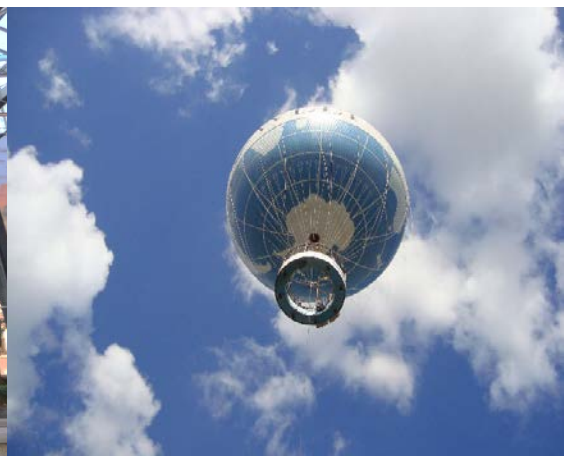
RL in der Luft