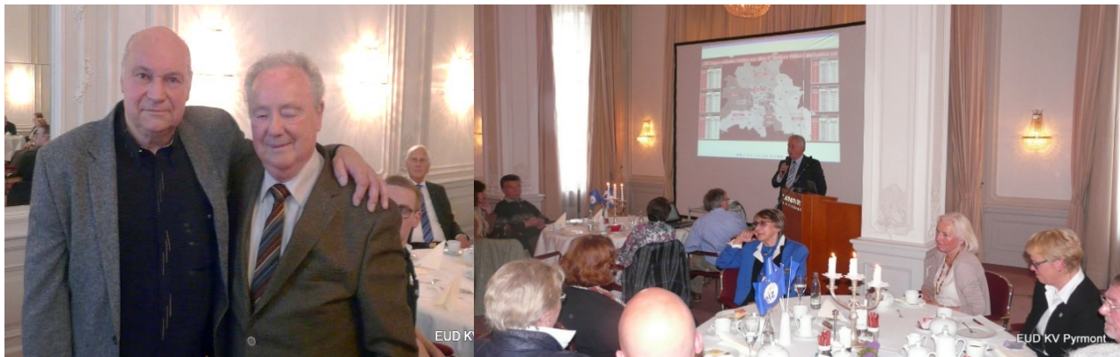
Zwei Polizeilehrer a.D.