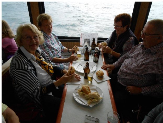
Mahlzeit an Bord auf Flensburger Förde