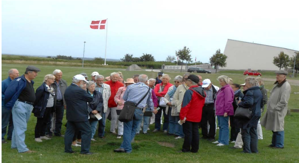
Düppeler Schanzen (Deutsch-Dänischer Krieg, 1864)