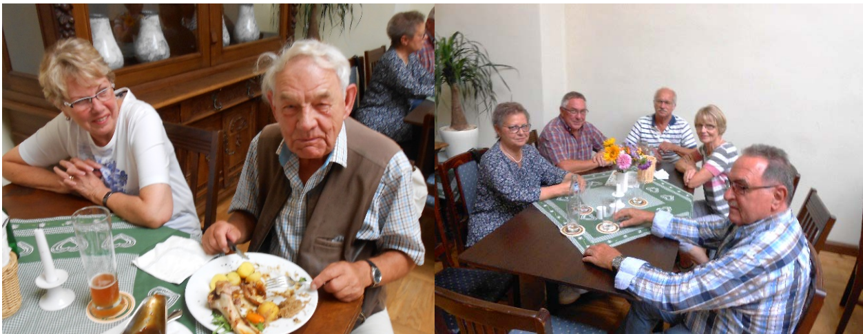
Europäer aus Bad Pyrmont & Hameln im Brauhaus Wittenberg