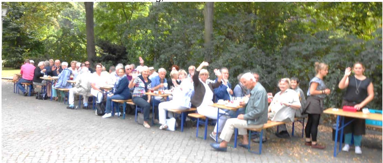
„Die Speisung der 50“, Mittagspause im Park von Schloss Schönhausen