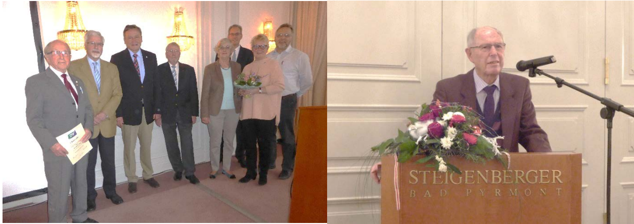
der am 15.03.2017 gewählte Vorstand;