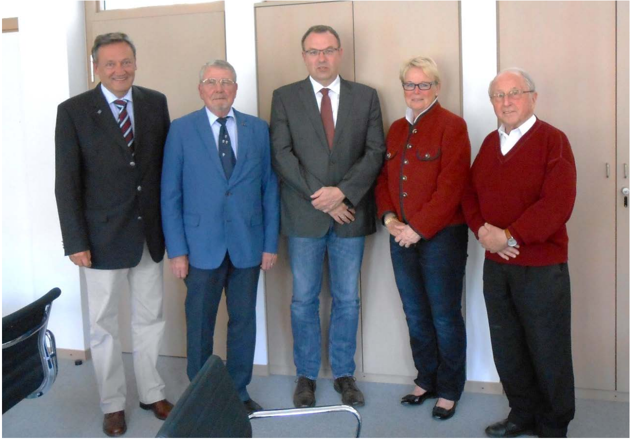
Antrittsbesuch des Vorstands beim neuen Bürgermeister