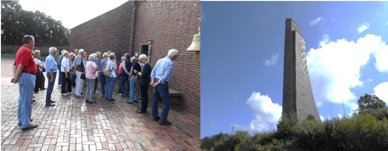
Am Marineehrenmal Laboe, Kiel