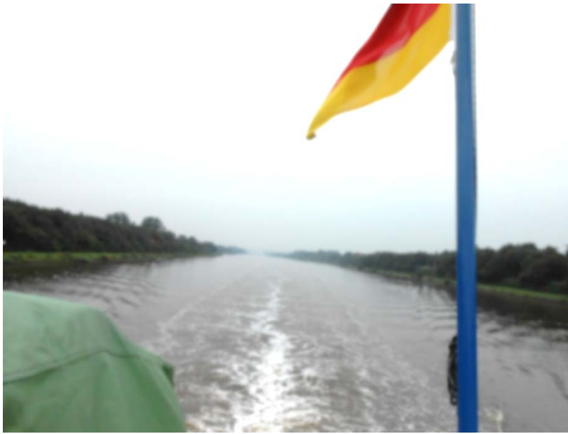
Blick auf Nord-Ostsee-Kanal am windgeschützten Heck der „Adler-Princess“