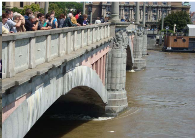
Hochwasser in Prag