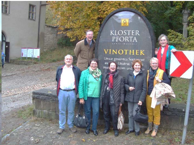
Durch das Weingebiet der Saale-Unstrut-Region 2014 Bodensee-Gebiet