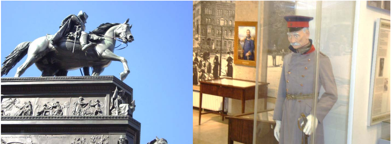
Bekannte Herrscher und Schelme