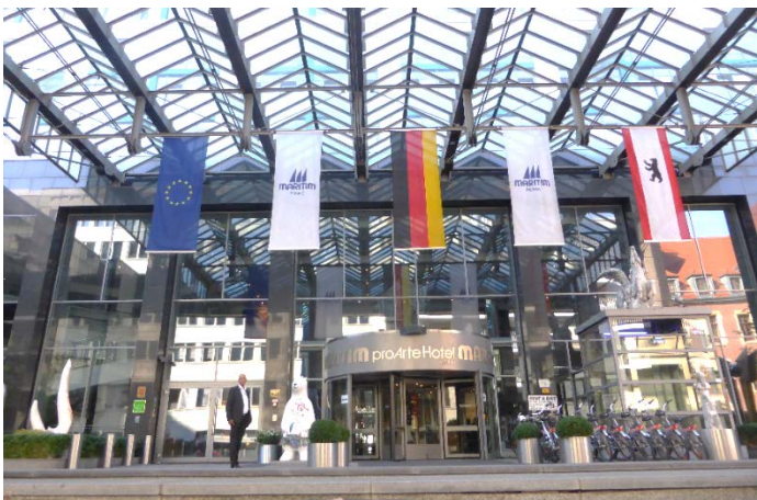
Hotel Maritim del Arte, Friedrichstraße, Berlin