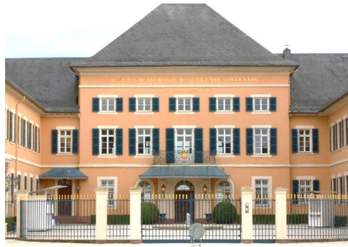
Gläserne Terrasse auf Metternich-Schloss Johannisberg im Rheingau