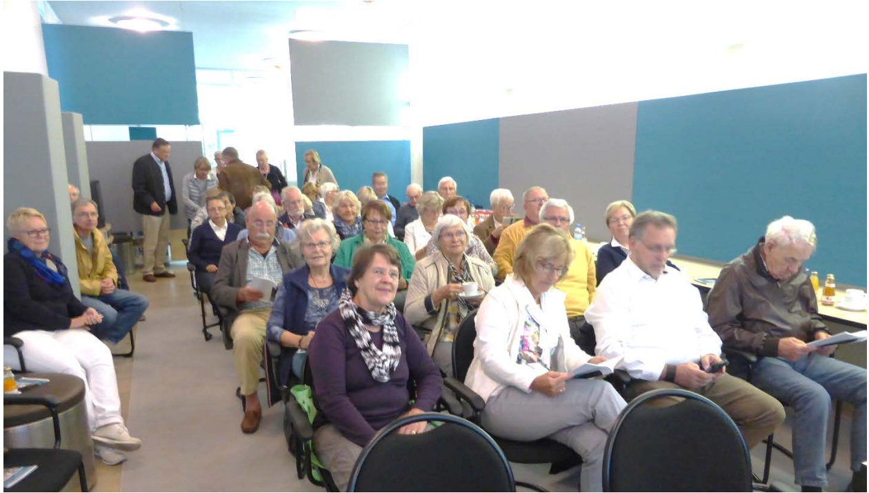
Besuch im Bundesrechnungshof, Bonn