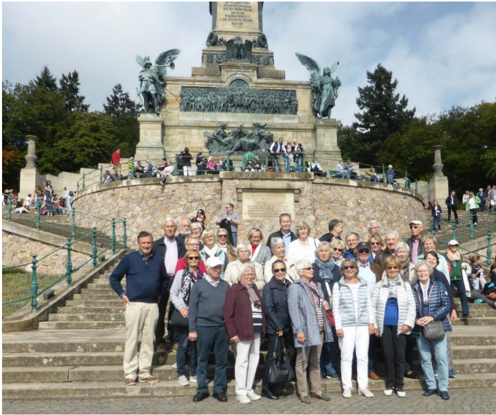
Niederwald-Denkmal, einst Zeichen deutscher Einigung; heute Teil Unesco-Welterbe und mögliches Symbol deutsch-französischer Aussöhnung