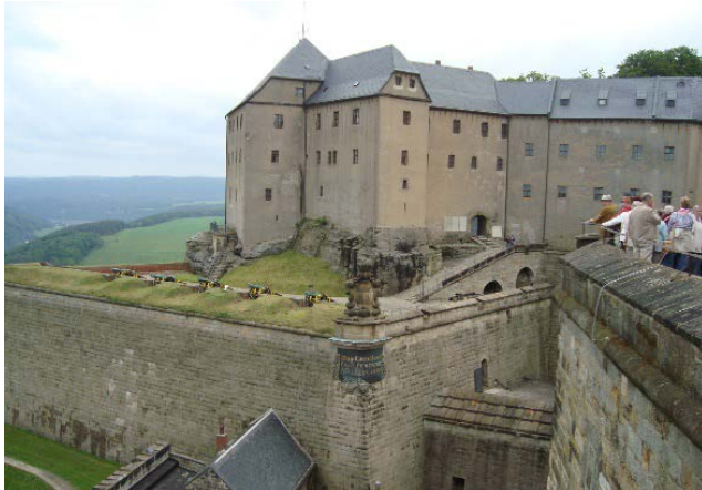
Festung Königstein oberhalb der Elbe

2013 Prag, Elberegion, Leipzig, Saale-Region